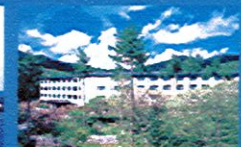
リゾートホテル ラフォーレ山中湖 0555-65-8489