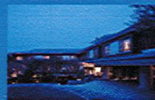
ラフォーレ倶楽部 箱根強羅 湯の楼 0460-86-1489