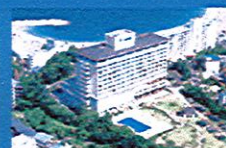
リゾートホテル ラフォーレ南紀白浜 0739-82-1489