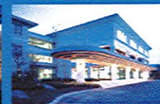
総合リゾートホテル ラフォーレ修善寺 0558-74-5489