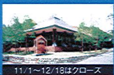
ラフォーレ倶楽部 ホテル白馬八方 0261-75-5489