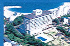
リゾートホテル ラフォーレ南紀白浜 0739-82-1489