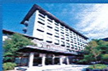
リゾートホテル ラフォーレ那須 0287-76-3489