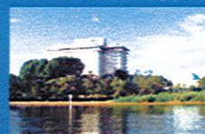
総合リゾートホテル ラフォーレ琵琶湖 077-584-3489