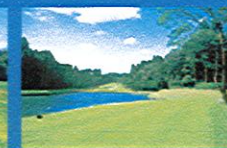
優待ゴルフ場 ラフォーレ&松尾ゴルフ倶楽部 0479-86-6400