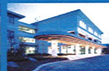
総合リゾートホテル ラフォーレ修善寺 0558-74-5489