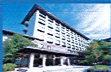
リゾートホテル ラフォーレ那須 0287-76-3489