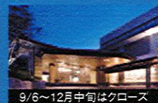
ラフォーレ倶楽部 伊東温泉 湯の庭 0557-32-5489