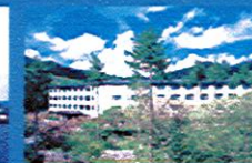
リゾートホテル ラフォーレ山中湖 0555-65-8489