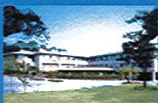
ラフォーレ倶楽部 ホテル中軽井沢 0267-44-4489