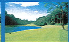
優待ゴルフ場 ラフォーレ&松尾ゴルフ倶楽部 0479-86-6400

空室情報・お得なプラン・イベント情報満載! http://www.laforet.co.jp ラフォーレ 検索 法人会員No. 60313 法人パスワード 60313ck