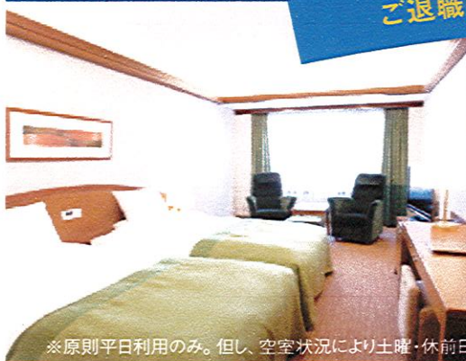
※原則平日利用のみ。但し、空室状況により土曜・休前日も利用可。