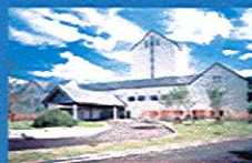
ラフォーレ蔵王 リゾート&スパ 0224-34-1489