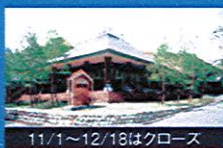
ラフォーレ倶楽部 ホテル白馬八方 0261-75-5489