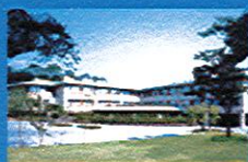
ラフォーレ倶楽部 ホテル中軽井沢 0267-44-4489