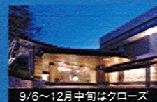
ラフォーレ倶楽部 伊東温泉 湯の庭 0557-32-5489