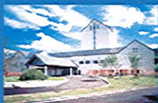
ラフォーレ蔵王 リゾート&スパ 0224-34-1489