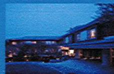
ラフォーレ倶楽部 箱根強羅 湯の楼 0460-86-1489